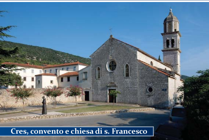
Cres, convento e chiesa di s. Francesco