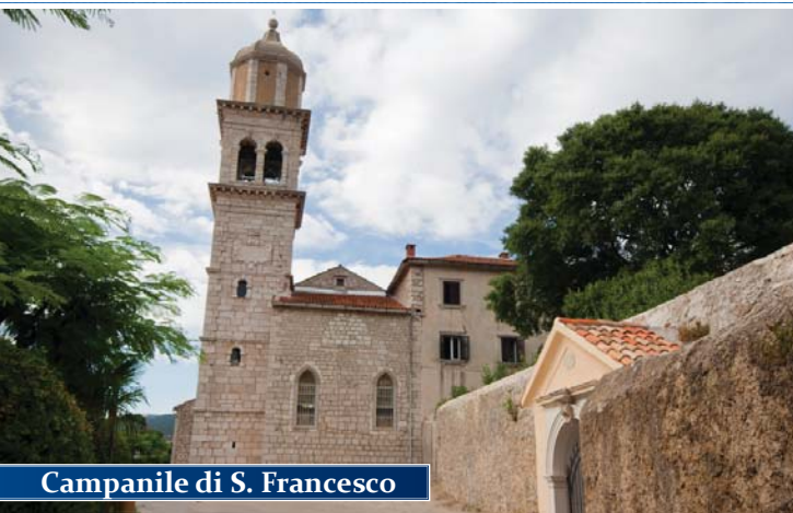
Campanile di S. Francesco