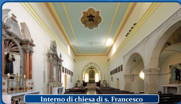
Interno di chiesa di s. Francesco

L'odierna Chiesa di San Francesco venne costruita nel XV secolo, in stile gotico francescano. Nel 1520 la famiglia chersina De Petris (Petric) allargò la chiesa aggiungendo una cappella in stile rinascimentale. Nel 1695 venne aggiunto alla chiesa un bel campanile che acquistò la forma attuale nel 1854.