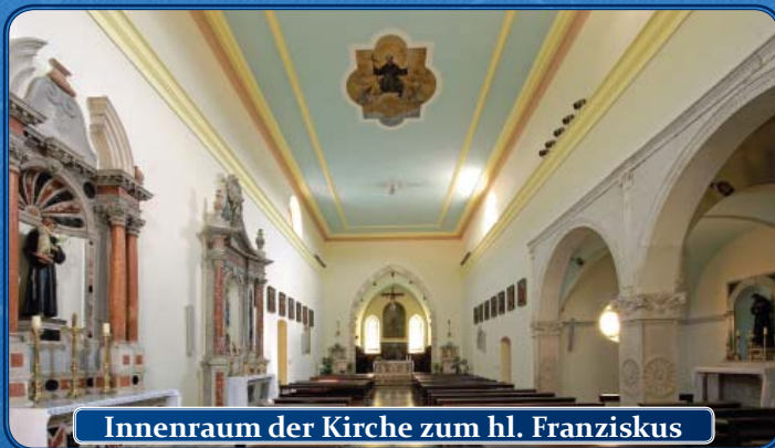
Innenraum der Kirche zum hl. Franziskus

Die heutige Kirche zum hl. Franziskus wurde im 15. Jahrhundert im gotischen Stil erbaut. Die Creser Adelsfamilie De Petris (Petric) erweiterte 1520 die Kirche, indem eine Kapelle im Renaissancestil hinzugefügt wurde. Im Jahr 1695 wurde ein sehr schöner Kirchturm errichtet, dessen gegenwärtiges Erscheinungsbild seit 1854 besteht.