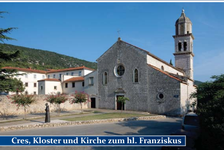
Cres, Kloster und Kirche zum hl. Franziskus