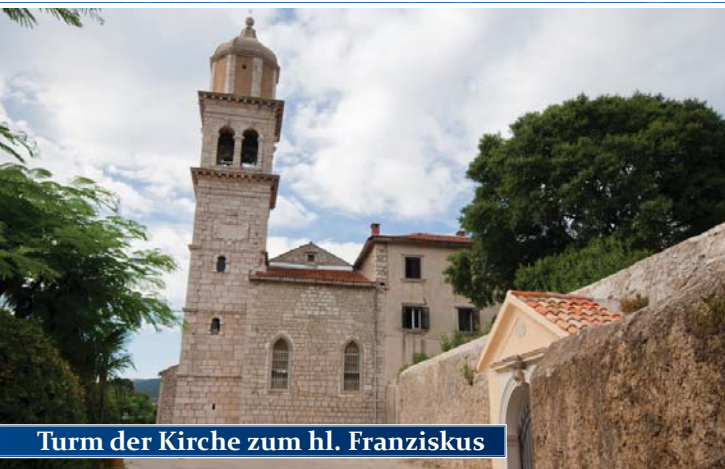
Turm der Kirche zum hl. Franziskus